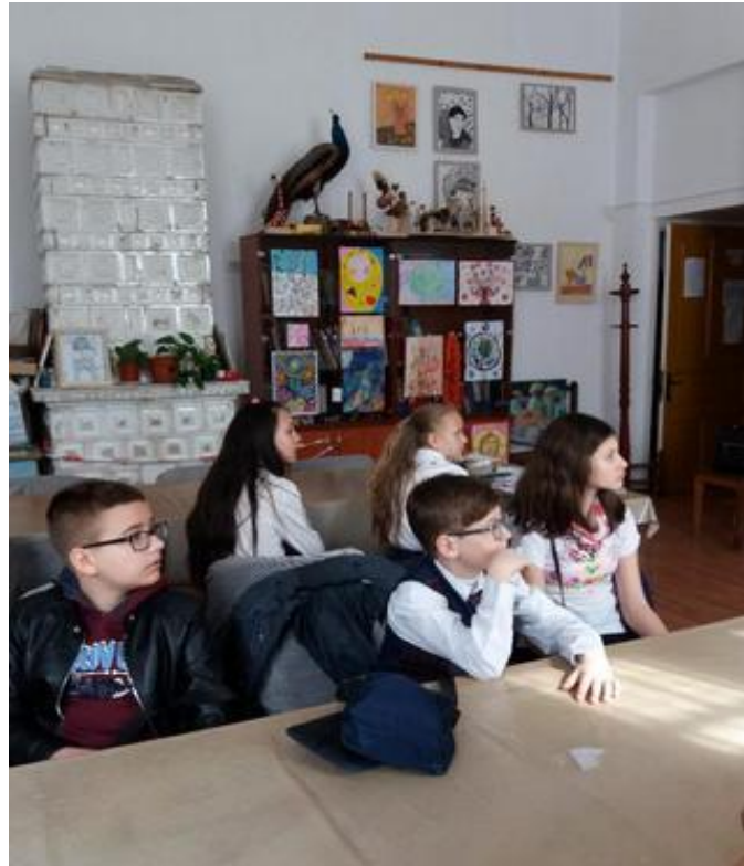
VIZIONARE FILM DOCUMENTAR