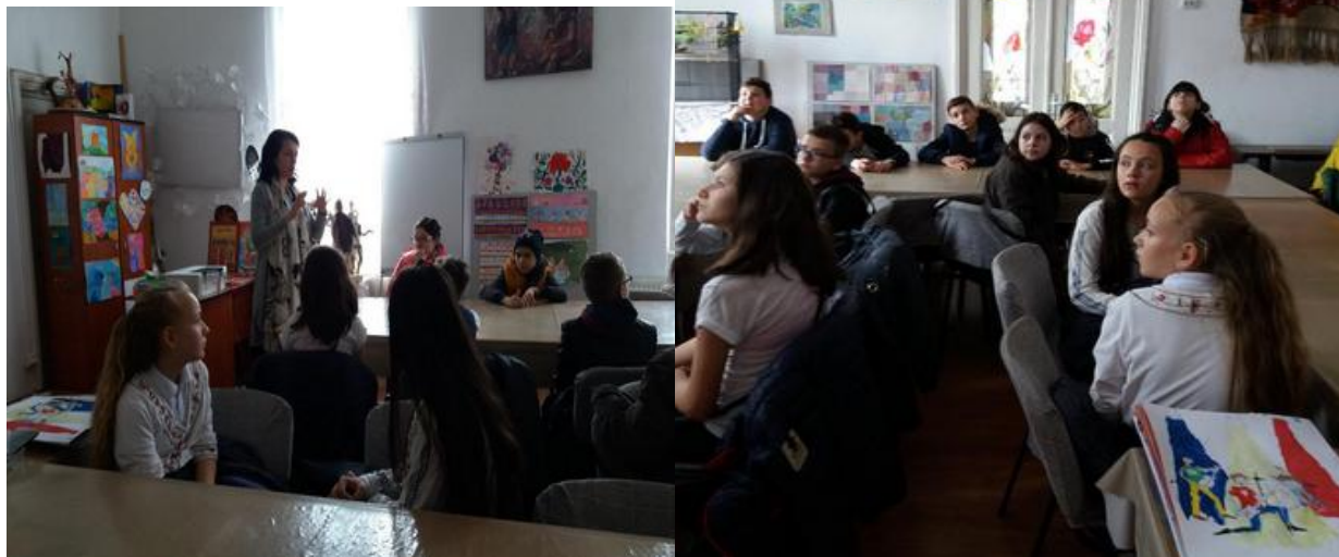
CENTENARUL MARI UNIRI LA PALATUL COPIILOR GALAȚI