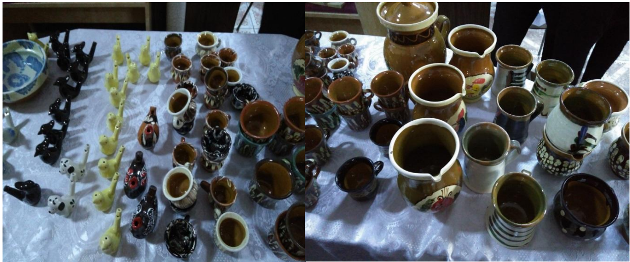
ATELIER DE OLĂRIT