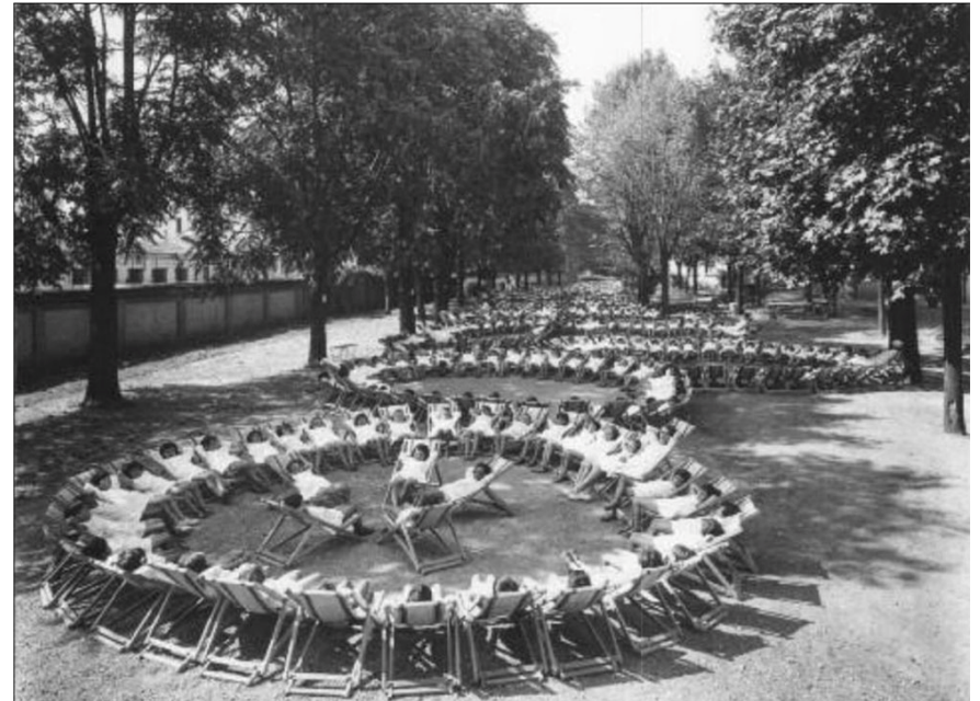
Scuola all'aperto Umberto di Savoia 1929