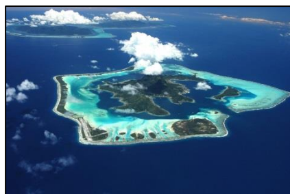
1- Insula Bora Bora