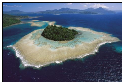
2- Insula Noua Guinee