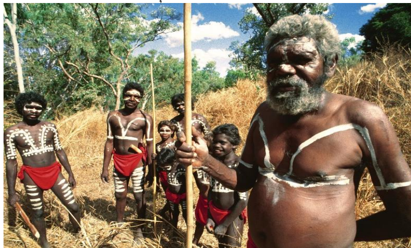
Populație aborigenă din Australia

Aborigenii australieni sunt primii oameni care au colonizat continentul australian. Odată cu sosirea coloniștilor englezi, în 1788, populația aborigenă a scăzut, în special din cauza bolilor, dar și datorită conflictelor violente cu coloniștii.