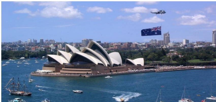
Opera din Sydney