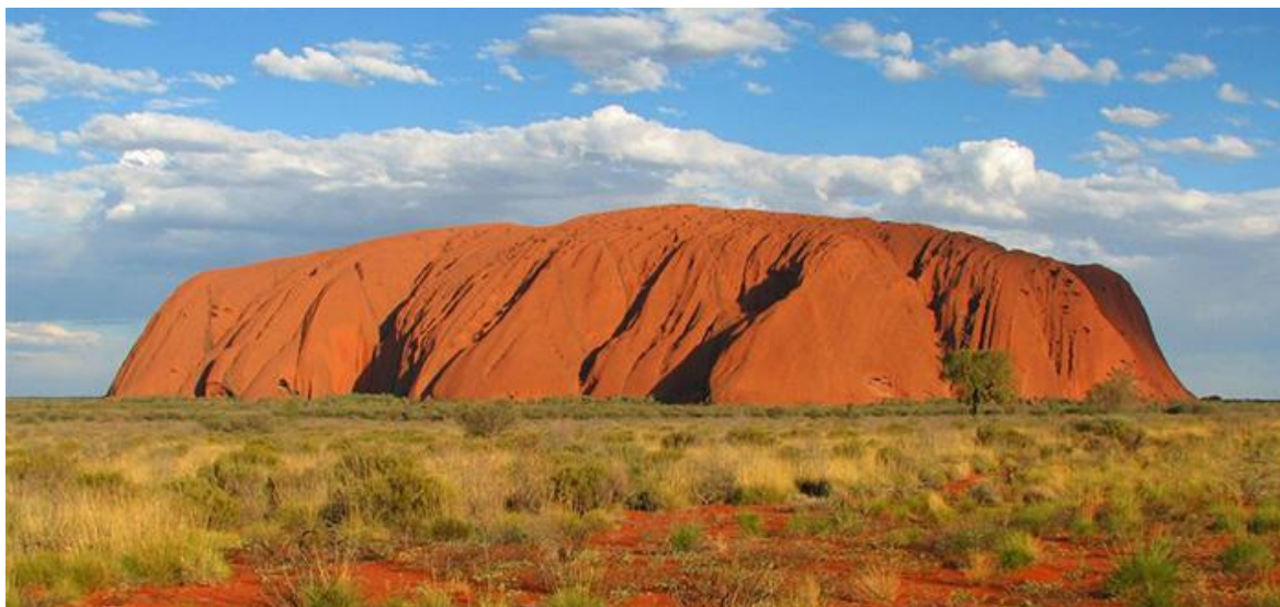
Muntele de granit roșu (Uluru sau Ayers Rock)

•în Est- un sistem montan (Cordiliera Australiană) cu altitudini relativ scăzute ( Munții Marii Cumpene de Ape ), care depășesc 2 000 m doar în sud ( Alpii Australiei, Vf. Kosciuszko, 2 228m ).